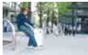
キャンパス内でも指定箇所以外は全面禁煙に