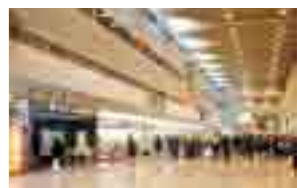
喫煙コーナーが廃止された羽田空港出発カウンター前ロビー