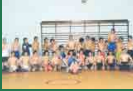
部員数▶男子28名 女子0名 活動日▶日曜日除く毎日 部室▶クラブ室棟15