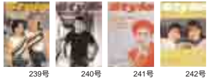
239号 240号 241号 242号 *バックナンバーを入手希望の方は、広報課までご請求ください。なお、『JINDAI Style』は神奈川大学公式ホームページhttp://www.kanagawa-u.ac.jpでもご覧になれます。

編集・発行 神奈川大学通信 [JINDAI Style] 編集専門委員会 [年5回 5・7・10・12・3月発行] 〒221-8686 横浜市神奈川区六角橋3-27-1 045 481 5661 Fax045 481 9300