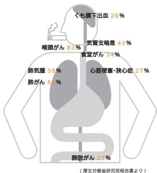
DATA 病死者のうちタバコが原因のものが占める割合

タバコの煙に含まれる化学物質は約4000種類。一酸化炭素やニコチンは動脈硬化を促進させ、また、煙に含まれる発がん物質が、肺がんや喉頭がんなどの多くのがんの原因になると推定されています。ちなみに、喫煙を始めた時期が早いほどリスクは高く、非喫煙者が60歳までに肺がんで死亡する割合に比べて、16~25歳に吸い始めた人は15倍になるとい調査データもあります。