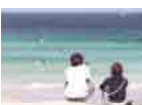
南伊豆白浜はマリンブルーの海・白い砂浜の続く美しいビーチ

平成15年度国民体育大会が静岡県で開催されます。あらゆるスポーツの全国のツワモノが静岡に集結し、熱戦を繰り広げるのです。私はスポーツが大好きなので、前々からとても楽しみにしていました。いくつかの会場に足を運び、この目で競技を観て、選手と一緒に熱くなるぞ!と意気込んでいます。今年は、静岡県にとつて、熱い1年になること間違いなしです!